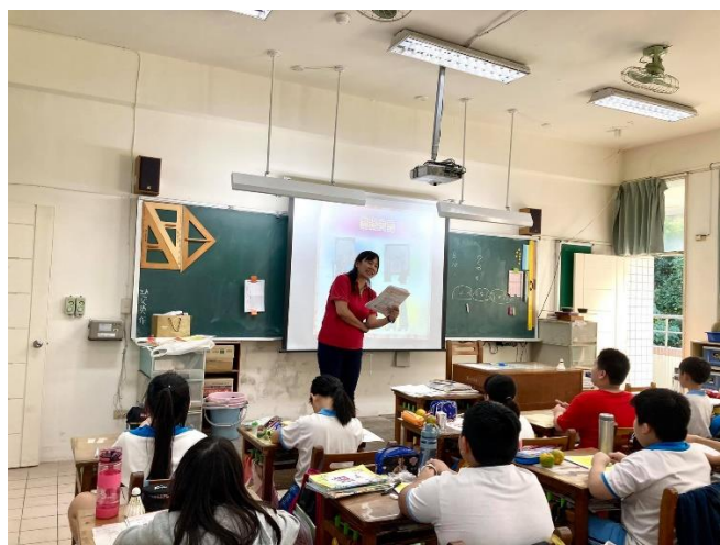
照片說明：EQ 組志工人班宣導