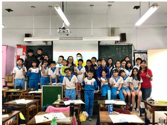
照片說明：EQ 組志工人班宣導