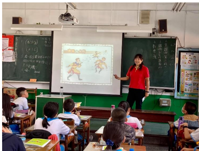
照片說明：EQ 組志工人班宣導

活動內容：在志工們的帶領下，小朋友透過有趣的互動方式（如說故事、演話劇、心理測驗）進行體驗、討論與思考，並於輕鬆的氛圍中，逐漸獲得實用的 EQ 知識，也提升了親子關係 與班級經營的品質。