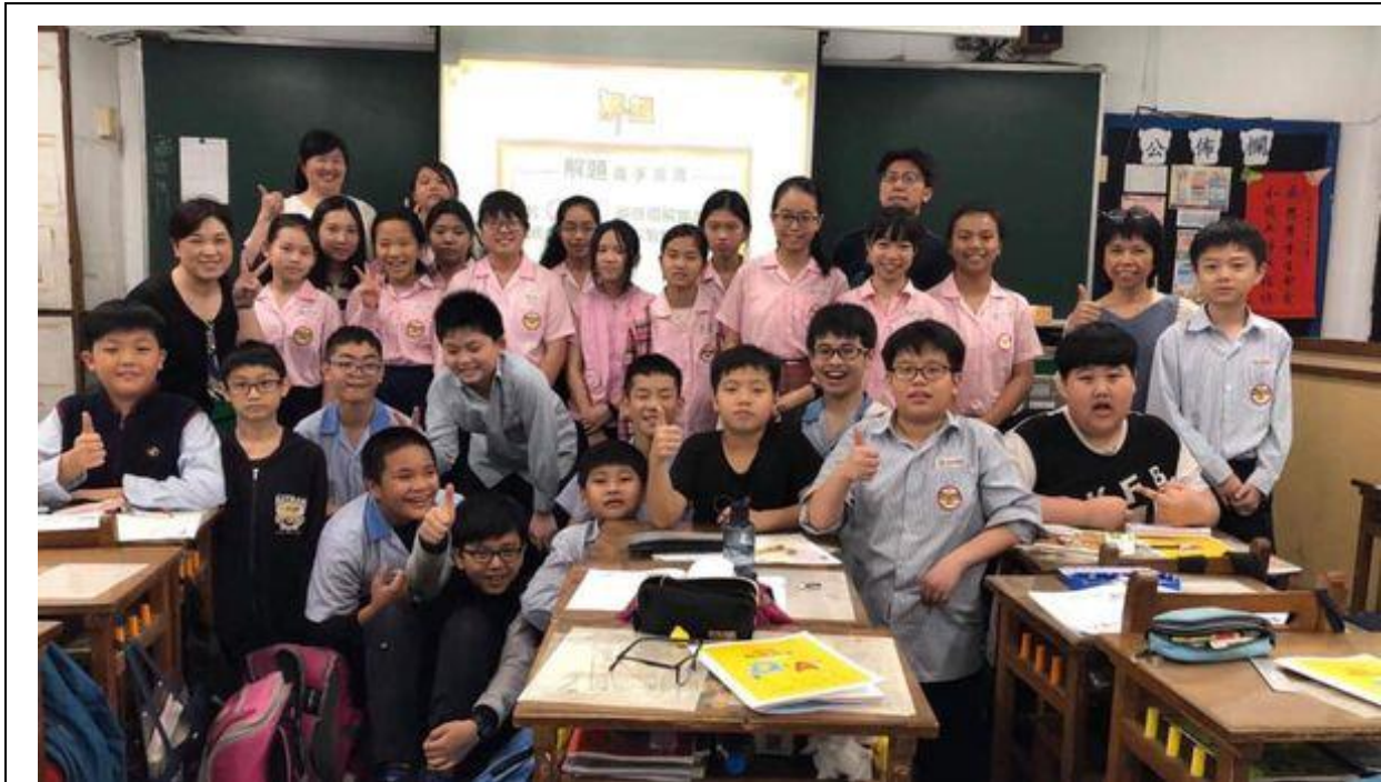
照片說明：EQ 組志工入班宣導

活動內容：在志工們的帶領下，小朋友透過有趣的互動方式（如說故事、演話劇、心理測驗）進行體驗、討論與思考，並於輕鬆的氛圍中，逐漸獲得實用的 EQ 知識，也提升了親子關係與班級經營的品質。