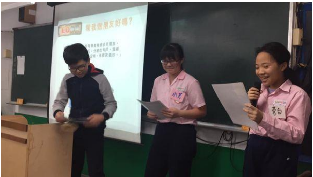
照片說明：學生表演話劇