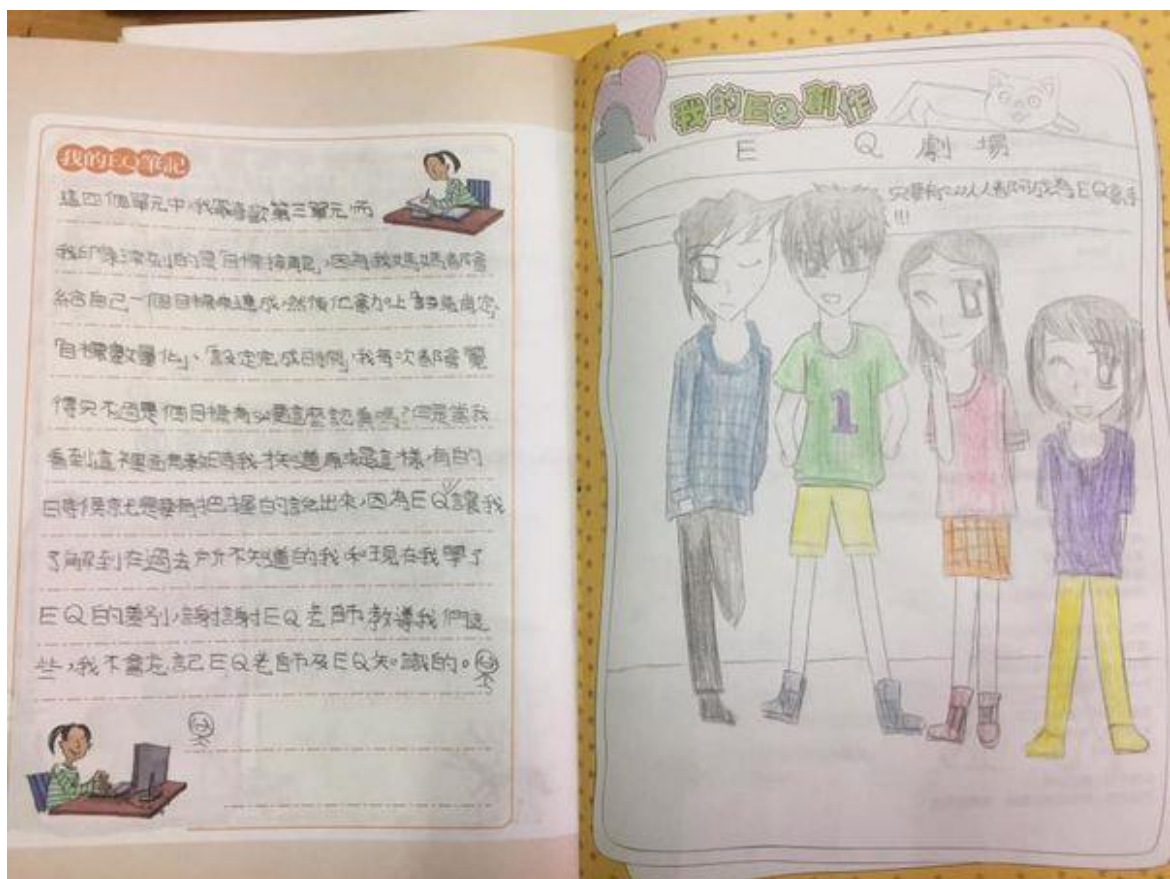
照片說明：填寫 EQ 手冊